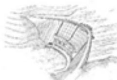
k) Barrage hydroélectrique